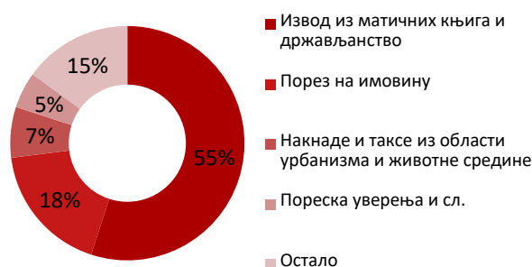
Најчешћа плаћања картицом на шалтеру

Из перспективе грађана, поред нижих провизија, такмичење је донело и значајне уштеде у времену, јер нису морали да одлазе до поште или банке, враћају се, и два пута чекају у реду приликом прибављања различитих уверења, дозвола, решења, извода и других докумената, већ су све могли да заврше на једном месту – у шалтер сали локалне самоуправе. На овај начин грађани су уштедели и до 500 дана чекања у редовима .